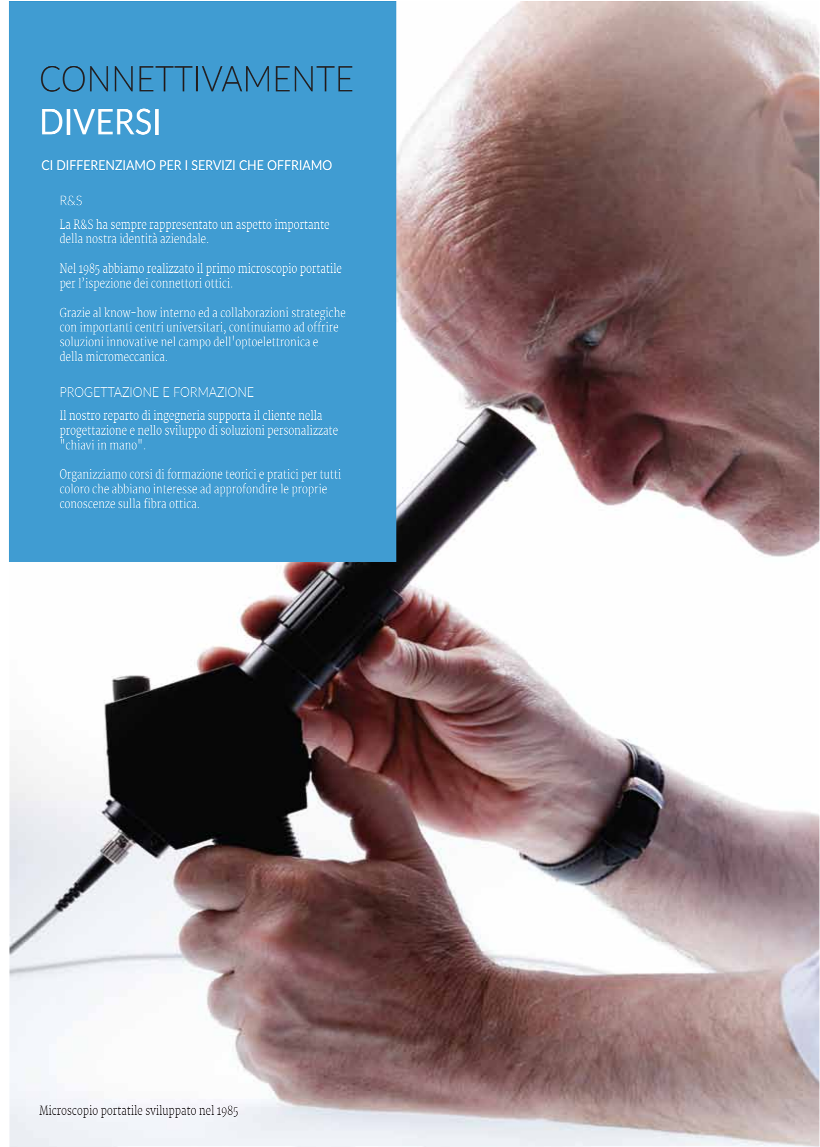
Microscopio portatile sviluppato nel 1985

Organizziamo corsi di formazione teorici e pratici per tutti coloro che abbiano interesse ad approfondire le proprie conoscenze sulla fibra ottica.