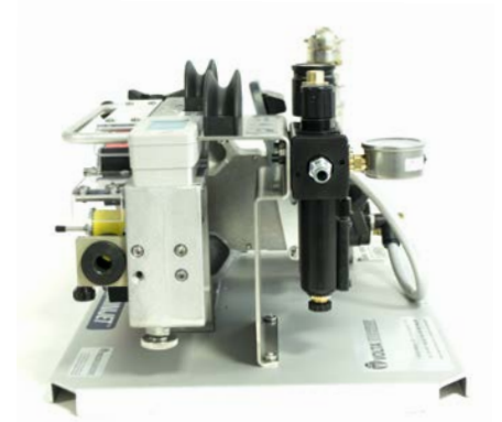
Vista laterale destra