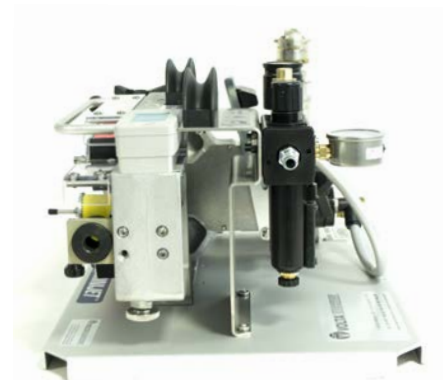
Vista laterale destra