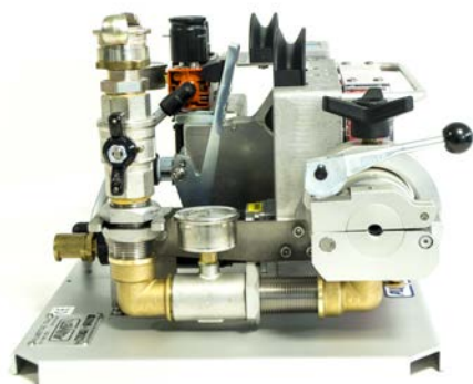
Vista laterale sinistra