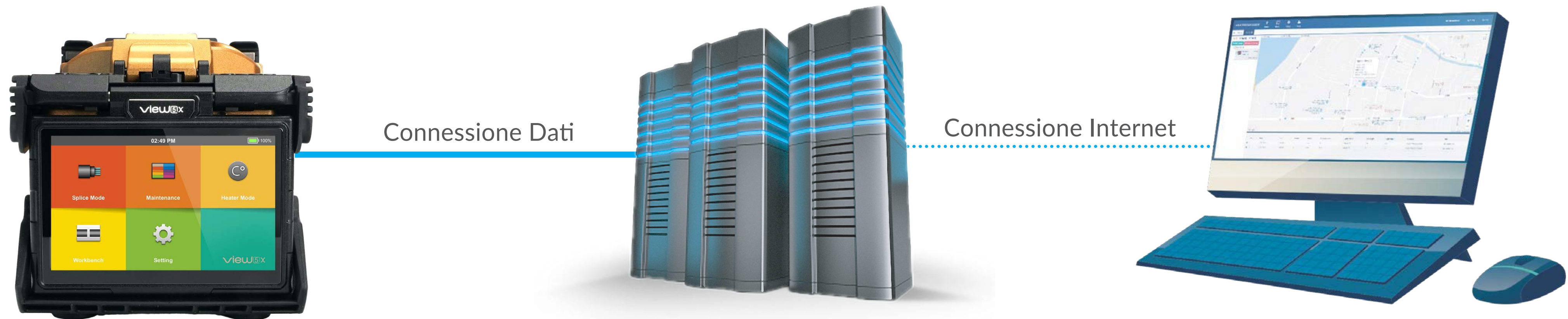
Giuntatrici INNO Serie View X

Le giuntatrici della serie View X rientrano negli incentivi INDUSTRIA 4.0 grazie al SISTEMA DI GESTIONE VIEW PRO MANAGER